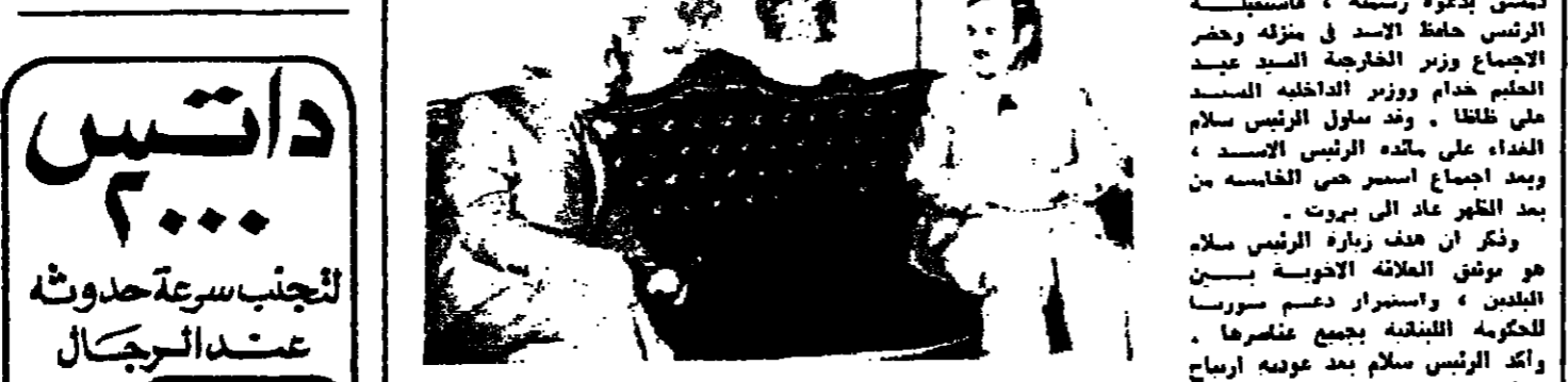
الرئيس الاسد اثناء استضافته الرئيس سلام امس

داتيس ٣٠٠٠ لثجنب سرعة حدوثه عند الرجكال الركيل التام: ٤٨٩٢ بيروت. لبنان رفيق خوري